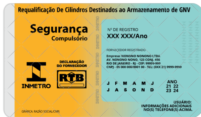
ADESIVO DE SEGURANÇA FAQUEADO DESTRUTÍVEL